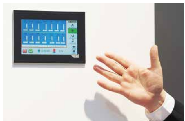
Ganz einfach - die Bedienung des Remeha ELW 5-7-11

Die Software Remeha/Report sammelt regelmäßig die aktuellen Leistungsdaten, die sich anschaulich und leicht verständlich in Grafiken und Tabellen aufbereiten lassen. Das macht es einfach, die Anlage optimal auf den eigenen Verbrauch einzustellen. Für den Datentransfer an den geschützten Remeha Server werden alle drei ELWs serienmäßig mit einem Internetanschluss und einer 24-monatigen Mobilfunk-Internetflatrate ausgeliefert, die auf Wunsch verlängert werden kann. Während der Laufzeit eines Vollwartungsvertrages ist die Datenübertragung kostenlos.